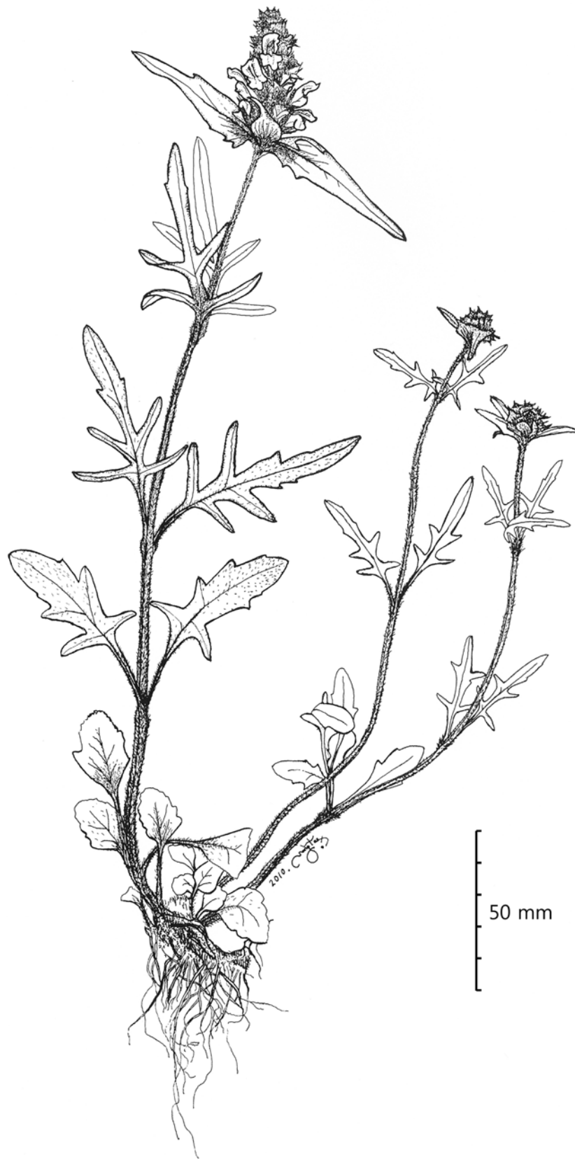
Fig. 1. An illustration of Prunella pinnatifida Pers. based on a collection in SWU (K.-H. Yoo s. n.).